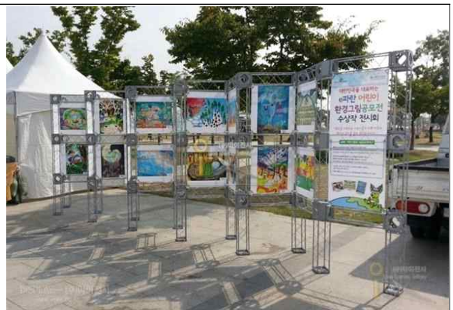
환경그림대회 입상작 전시 (예시)